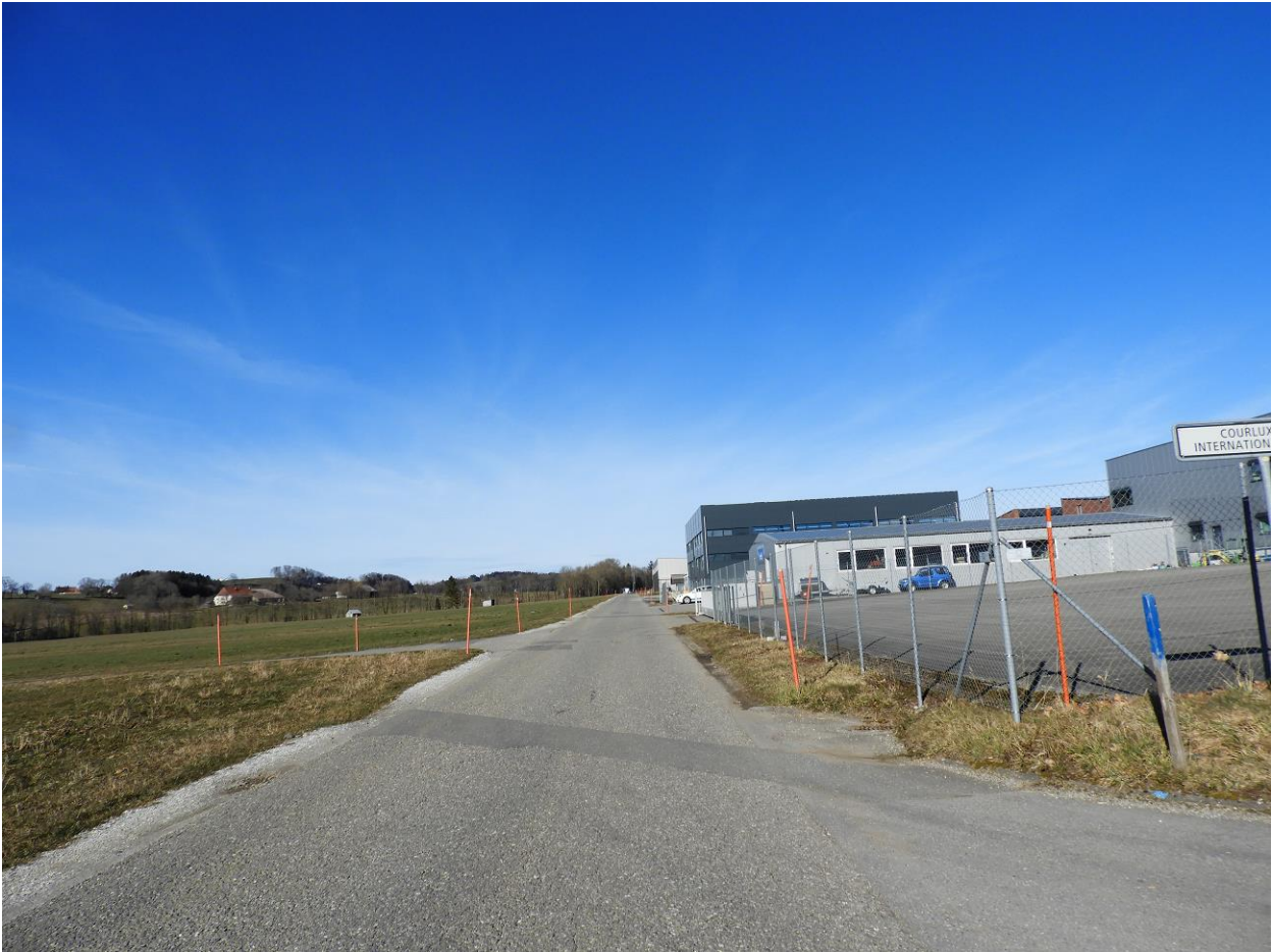
Le terrain se trouve le long de la route, à droite, juste après le bâtiment gris foncé.